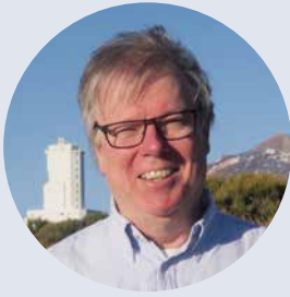
Dr. Dirk Soltau Astrophysiker

Mit zehn träumte er von einem Leben in einer Forschungsstation am Südpol, und mit vierzehn stand es fest: „Ich werde an den größten Teleskopen der Welt stehen und helfen, die Geheimnisse des Weltalls zu enträtseln.“