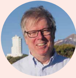
Dr. Dirk Soltau Astrophysiker

Mit zehn träumte er von einem Leben in einer Forschungsstation am Südpol, und mit vierzehn stand es fest: „Ich werde an den größten Teleskopen der Welt stehen und helfen, die Geheimnisse des Weltalls zu enträtseln.“